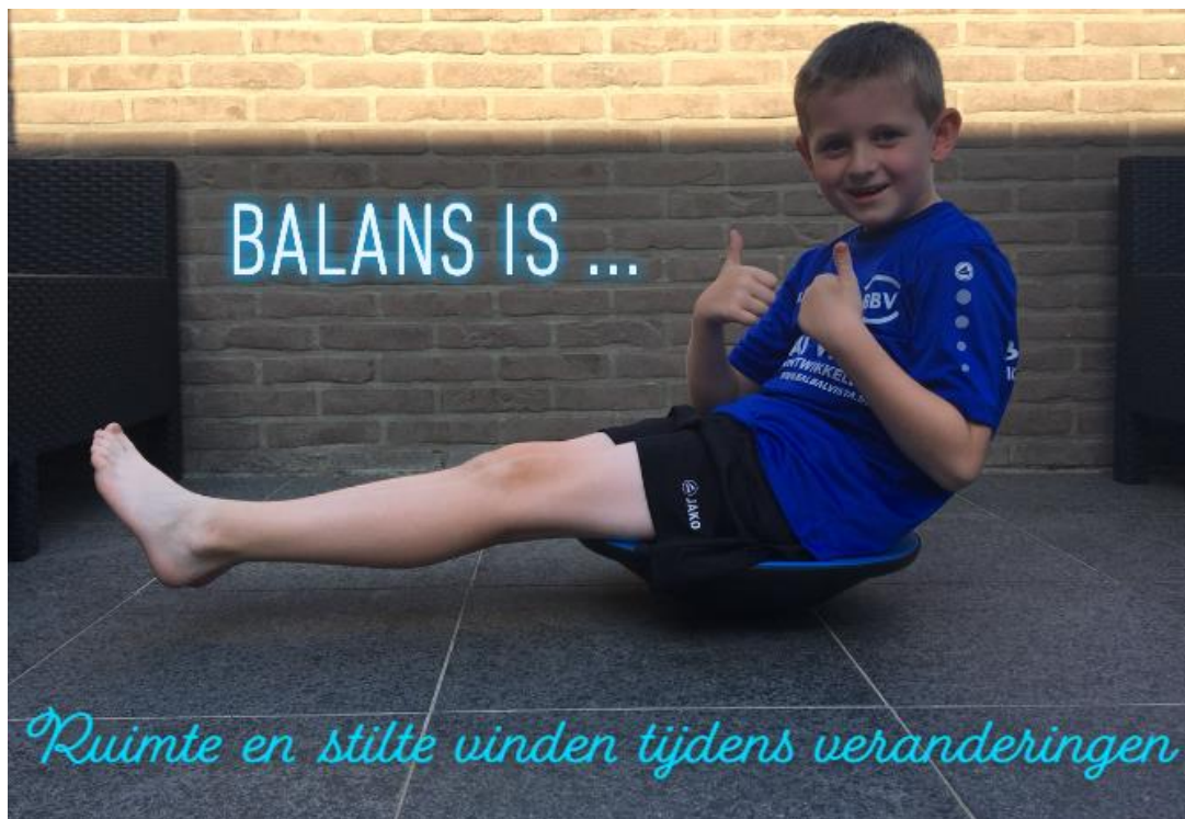
Emano thuis aan de slag